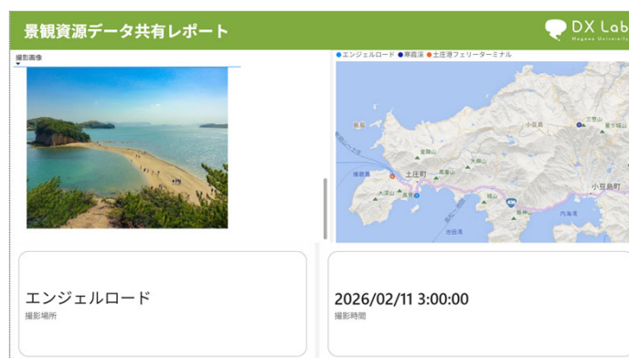
図 景観資源データ共有レポート